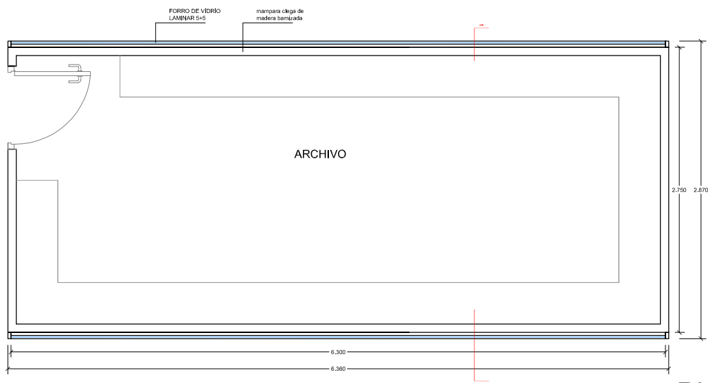
PLANTA esc. 1:50